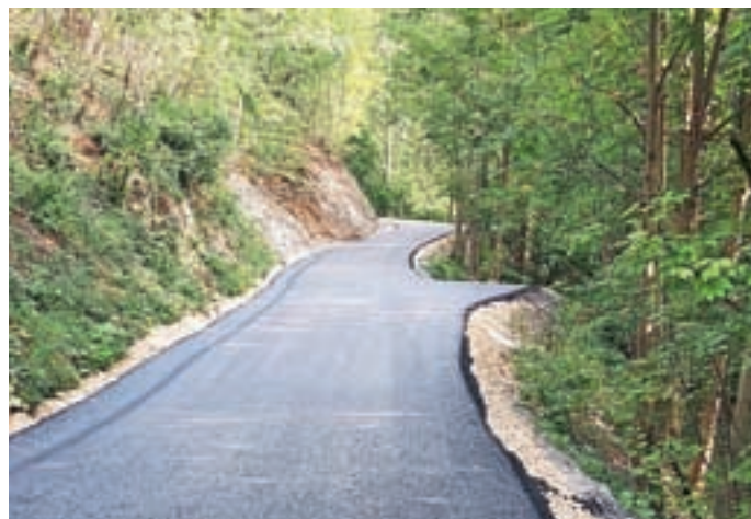
Asfaltiranje javne poti Čabrače–Zarobar

Zaradi pozne sklenitve pogodbe s podjetjem, ki bi poskrbelo za asfaltiranje v letu 2022, se je sanacija lokalne ceste Gorenja vas–Žirovski Vrh v dolžini 570 m izvedla v letu 2023. Vse leto se je izvajalo redno vzdrževanje lokalnih cest in javnih poti. Na pokopališču Gorenja vas so se izvajala nujna vzdrževalna dela.