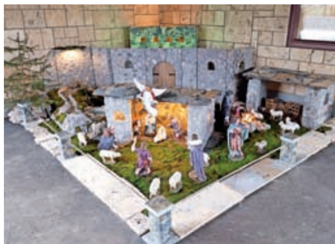
Jaslice pri cerkvi sv. Martina v Poljanah so bile letos postavljene zunaj, ker so v cerkvi potrebovali prostor za potrebe prenosa polnočnice na RTV Slovenija.