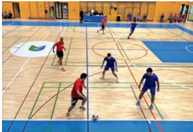
Na celodnevem Božičnem turnirju se je pomerilo 16 ekip.

Športni dogodek, ki v Gorenji vasi poteka že več kot 20 let, je organiziralo Športno društvo Sv. Urban. Pomerilo se je 16 ekip, na izpadanje so igrali od četrtfinala. Zmagajo je slavila ekipa Brus team iz Idrije, na drugo mesto se je uvrstila ekipa Keramičarstvo Dženis iz Ljubljane, na tretje pa Lučinski farani. Futsal, imenovan tudi dvoranski ali mali nogomet, je igra med dvema ekipama – vsaka s po petimi igralci, od katerih je eden vratar. Izvira iz Južne Amerike, kjer se je uveljavil na začetku 20. stoletja. Število menjav igralcev ni omejeno. Za razliko od nekaterih drugih oblik se futsal igra na trdi podlagi, ločeni s črtami. Igra se z manjšo žogo kot pri vsem bolj znanem nogometu na travi. Poudarek je na improvizaciji, ustvarjalnosti in tehniki, pa tudi nadzoru nad žogo, ki poteka na majhnem prostoru. Kot je povedal organizator Domen Homec iz ŠD Sv. Urban, je gorenjevaški turnir priljubljen tako med tekmovalnimi ekipami kot