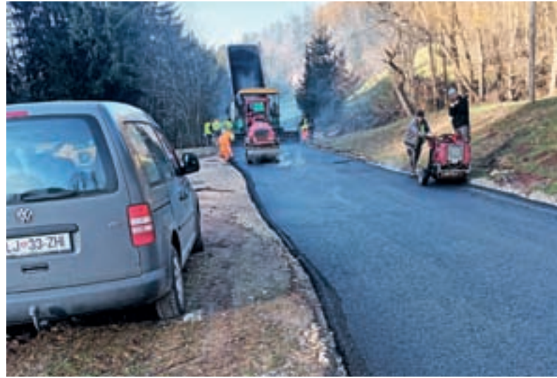
Asfaltirani so bili številni cestni odseki.

V počastitev slovenskega kulturnega praznika smo 8. februarja organizirali proslavo v kulturni dvorani. V aprilu smo s pomočjo društev v naši krajevni skupnosti izvedli vsakoletno očiščevalno akcijo. Poleg pobiranja odpadkov po vodotokih in ob cestah je potekala tudi akcija čiščenja podstrešja v zadružnem domu. Na predvečer dneva državnosti smo v Novi Oselici poskrbeli za organizacijo slovesnosti v počastitev dneva državnosti. Na področju prometne infrastrukture je z občinskimi sredstvi potekala obnova LC Sovodenj–Stara Oselica–Ermanovec, kjer je bilo položeno več kot dva kilometra asfaltne prevleke. Dela na tem odseku še niso končana, k čemur so veliko pripomogle poplave v avgustu, nadaljevala se bodo letos. Zaradi katastrofalnih poplav in plazovitega terena je prišla na vrsto tudi prenova okrog 1200 m dolgega odseka LC Sovodenj–Javorjev Dol–Ledinsko Razpotje, kjer so bili urejeni tudi oporni zidovi. Prenovljen je bil tudi most na JP Laniše–Rupe–Lisjak. Poleg rednega letnega vzdrževanja lokalnih cest in javnih poti so bili urejeni na novo z asfaltno prevleko: 250 m dolg odsek JP Sovodenj–Stara Oselica–Vrhovc, 150 m dolg odsek JP Sovodenj–Koreninar in 100 m dolg odsek JP Pirc–Likarjeva bajta. Po poplavah v avgustu je potekala tudi solidarnostna akcija, kjer