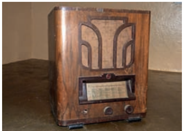
Radijski sprejemnik Philips 525A – 23 je star skoraj 90 let.