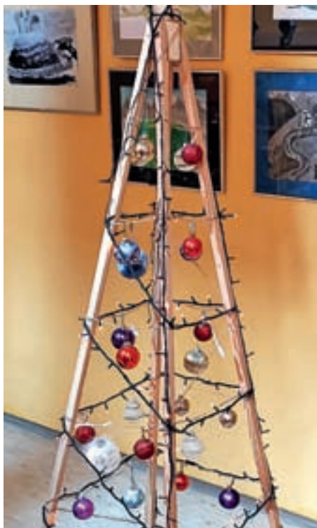
Učenci so izdelali novoletno jelko.

Vse dobro v novem letu želimo vsem bralcem Podblegaških novic!