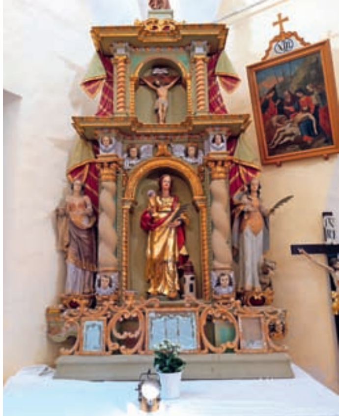
Na oltarju sv. Barbare je med mašo gorela rudarska svetilka.