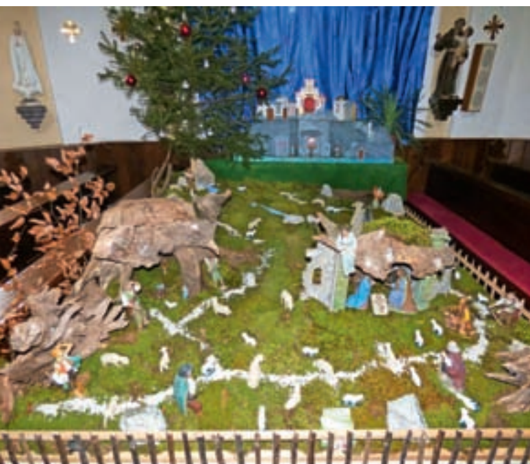
Jaslice v cerkvi sv. Pavla v Stari Oselci zavzemajo mesto na sredi ladje.