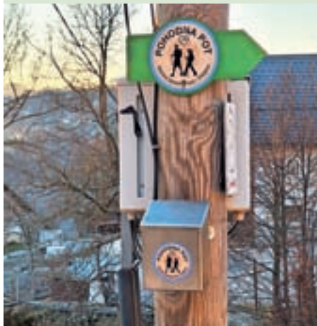
Občinski pohodni krog

Kontrolni žig Ograde (KT7) občinskega pohodnega kroga občine Gorenja vas - Poljane je iz Ograd prestavljen v Leskovicu na leseni elektro drog ob cerkvi svetega Urha. Prav tako je premaknjena kontrolna točka Okrepčevalnica Matija (KT3) kolesarskega kroga Občine Gorenja vas - Poljane na Kulturni dom Lučine.