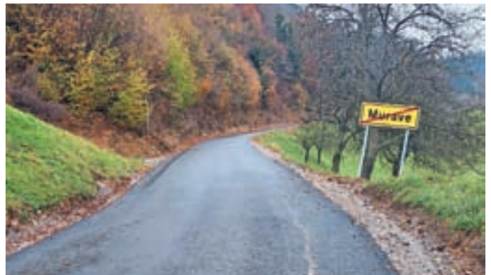
Uredili so tudi sedemstometrski odsek na cesti Murave–Podvrh.