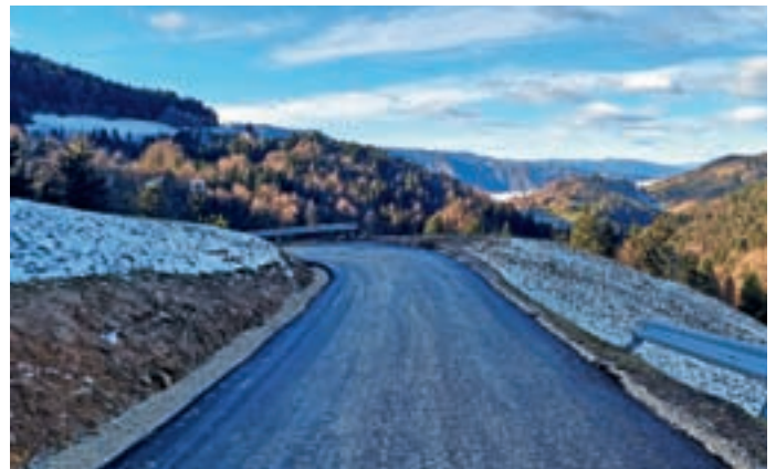
Obnovljeni odsek ceste v Javorjevem Dolu

Sanacije ceste v Javorjevem Dolu so se tako lotili v sklopu obnove po poplavih, in sicer so na novo uredili 1,2 kilometra dolg odsek, cesto pa so na tem delu tudi nekoliko razširili, je pojasnil Boštjan Kočar iz oddelka za okolje, prostor in infrastrukturo. V sklopu obnove so uredili tudi 15 cestnih prepustov in poskrbeli za odvodnjavanje meteornih voda, ki se razlivajo po okoliških