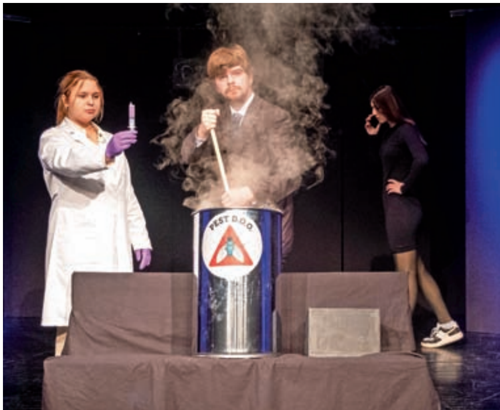
Prizor iz predstave Dizldorf

V predstavi z naslovom Verbšna, ki sta jo režirala Lenart Šifrer in Benjamin Jeram, pa se dogajanje odvija na osamljeni kmetiji Bukovec, kjer je živelo več generacij, a jo čas vse bolj prehiteva. »Ko