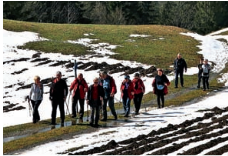
Prvi pohod v novi, že deseti sezoni bo Zimski pohod.

Pohodi niso pretirano težki, a je malico, ki jo pohodniki dobijo na pohodih in je vedno dobra in domača, vseeno treba »zaslužiti«. Tako kot že v lanskem letu tudi letos pripravljajo pohod, ki bo namenjen predvsem otrokom in se bo zaključil ob kresu pri koči na Starem vrhu, morda celo z novo pravljico za najmlajše. S pohodom se bo začel tudi najbolj prazničen dogodek v društvu – Dan oglarjev. Seveda pa je eden od pohodov namenjen obisku poljanskega očaka Blegoš, in sicer junija, ko je Blegoš v najlepšem cvetju. Ostaneta še dva pohoda, tradicionalni Javorje–Žetina–Javorje in Jesenski pohod. V društvu imajo pripravljen program in upajo le še, da jim bo vreme dobro služilo, četudi so pohodniki vajeni vseh vremenskih razmer. A kraji pod Starim vrhom so znani po tem, da imajo največ sončnih dni v letu in kot takšne jih svojim obiskovalcem tudi najraje pokažejo.