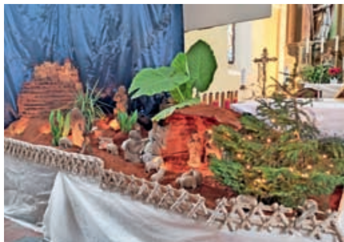
Jaslice v cerkvi sv. Janeza Krstnika na Trati v Gorenji vasi so tokrat dobile bolj orientalski pridih, saj so gorenjevaški jasličarji namesto standardnega mahu za oblikovanje pokrajine uporabili oranžni pesek.