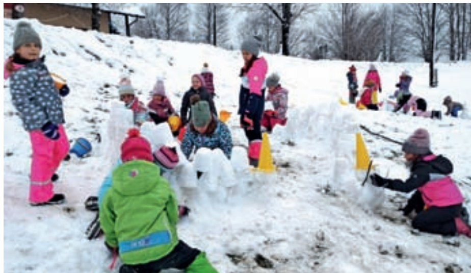
Zimske radosti na Medvedjem Brdu

Sedmošolci so pet dni preživel v pravljicni deželi pod Karavankami – v Centru šolskih in obšolskih dejavnosti Trilobit v Javorniškem Rovtu. Obiskali so izvir Velikega Javornika, spoznali fosile in jih odlili v mavec. Ponovili so osnove orientacije, se učili spretnosti oblikovanja osnovnih