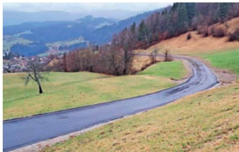
Lani smo bili najbolj veseli novega asfaltiranega odseka na relaciji Murave–Četena Ravan.

Lani je bilo ob cestah v naši KS postavljenih pet cestnih ogledal, sodelovali smo v čistilni akciji skupaj s KS Luša ter Turističnim društvom Stari vrh, 24. julija je bila organizirana proslava ob dnevu državnosti. Finančno smo sodelovali pri miklavževanju, saj je Miklavž obdaril kar 120 otrok, starih od enega do deset let. Ker je v Javorjeh zares velika prostorska stiska tako v šoli, vrtcu in gasilskem domu, je zares vesela novica, da se je zagotovilo zemljišče za nov večnamenski objekt. Celotno občino so lani močno zaznamovale poplave. Za KS Javorje lahko rečem, da nismo bili izrazito prizadeti glede poplav, a je kljub