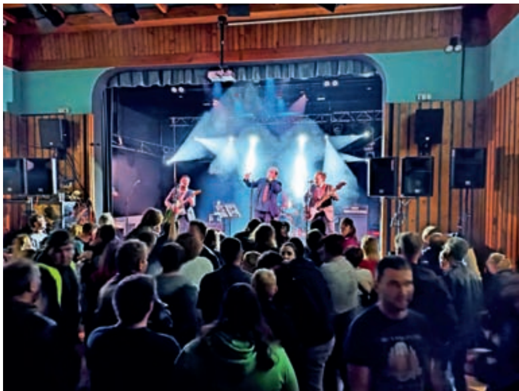
Nastop dveh legendarnih rokovskih skupin je na Sovodenj privabil številne ljubitelje te glasbene zvrsti.

oboji pri ljubiteljih rokovske glasbe že kar legendaren status, njihov skupni nastop pa se je izkazal za posrečeno kombinacijo. Cilj organizatorjev iz KUD Sovodenj je predvsem pripraviti dober »žur« ob kakovostni glasbi za ne previsoko vstopnino, tako da je dostopen širšemu občinstvu. Za to se trudijo prostovoljci iz društva, ki skupaj s še nekaterimi sokrajani in prijatelji opravijo veliko prostovoljnega dela. Tudi tokrat je bilo tako. V KUD Sovodenj že načrtujejo izvedbo 18. koncerta Rock'n nov lit na prvo soboto v januarju 2025.