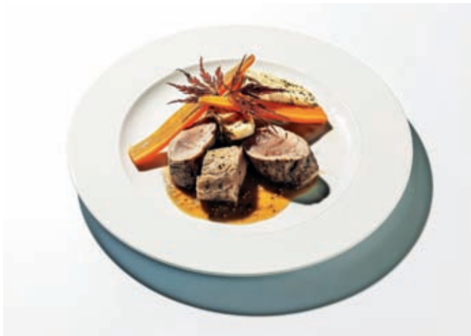
Primer krožnika s festivalskega menija gostilne Lipan

druženja gostincev, izmenjave mnenj in izkušenj. Pestra ponudba lokalnih pridelkov in izdelkov je rezultat pridnega dela in ustvarjanja ljudi na Škofjeloškem. Povezovanje gostinskih ponudnikov in lokalnih ponudnikov, z območja naše občine jih je bilo več kot deset, prinaša priložnost za domače in tuje goste, ki tako okušajo kulinarčne dobrote škofjeloškega območja.